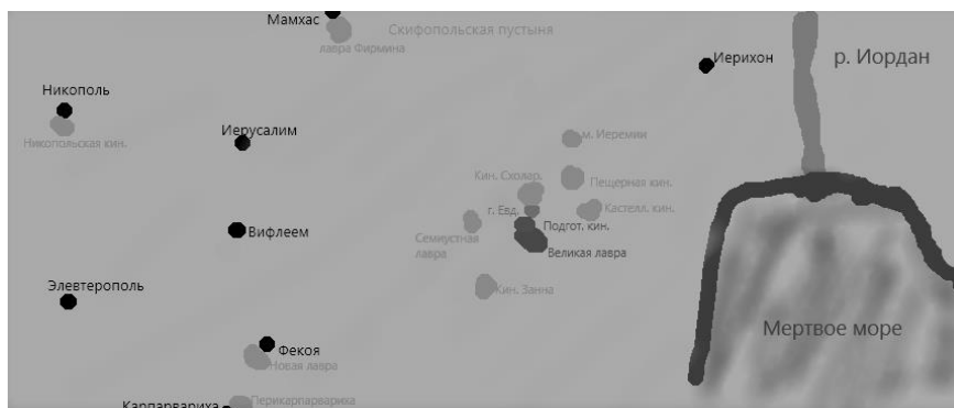
Рис. 1. Карта расположения монастырей св. Саввы и его учеников (по «Житию св. Саввы») Fig. 1. Map of the location of the monasteries of St. Saba and his disciples (according to «The Life of St. Saba»)