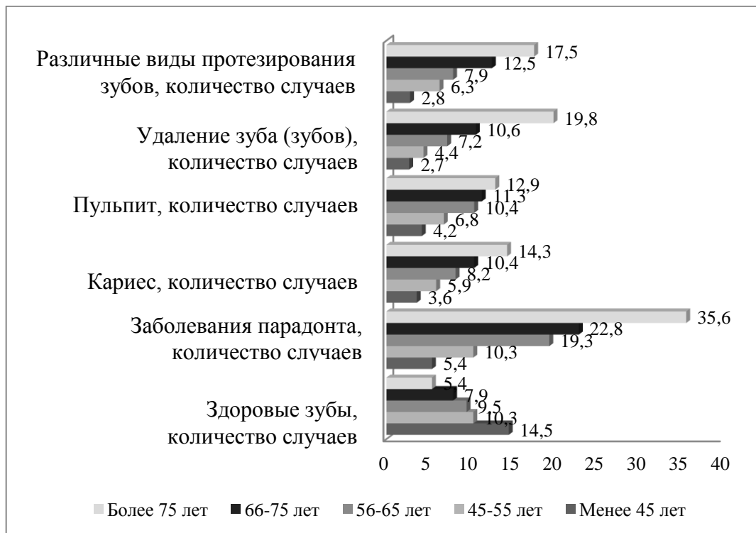
Рис. 2. Результаты исследования карт пациентов, страдающих сахарным диабетом и стоящих на учете в стоматологической поликлинике № 1 г. Белгорода.

Кроме того, у больных сахарным диабетом отмечаются различные заболевания пародонта, количество которых также увеличивается с возрастом. Исследование показало, что количество таких заболеваний у исследуемых пациентов возросло в 6 раз (от 5,4 случаев у пациентов моложе 45 лет до 35,6 случаев у пациентов старше 75 лет). Это связано с тем, что состояние сосудов и иммунитет у больных сахарным диабетом с возрастом ухудшается, и организм не может сопротивляться различным агрессивным воздействиям внешней среды.