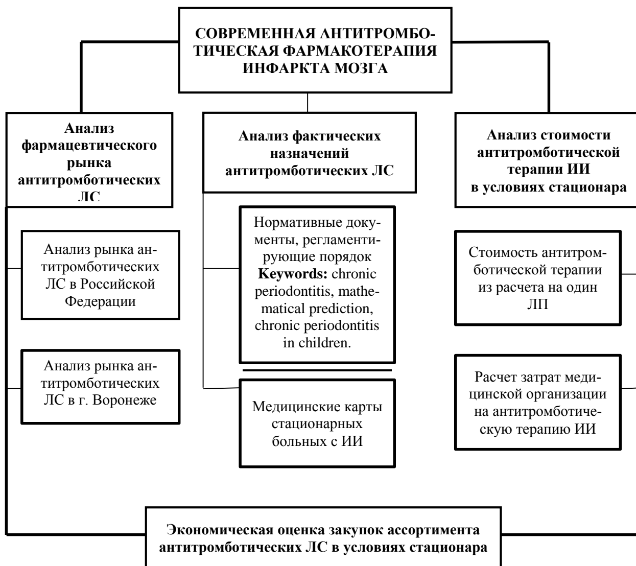
Рис. 1. Дизайн исследования

дирующую позицию по количеству ТН занимает клопидогрел, представленный 31 ТН (31.64%), далее следует ацетилсалициловая кислота (АСК) с 12 ТН (12.24%). Третье место делят гепарин натрий и пентоксифиллин, имеющие по 8 ТН (по 8.16%), затем дипиридамол – 7 ТН (7.15%), варфарин – 5 ТН (5.10%), эноксапарин натрий – 4 ТН (4.08%). По 2 ТН (по 2.04%) имеют надропаринкальций, тиклопидин, сулодексид, илопрост. У остальных 15 МНН по 1 ТН (по 1.02%).