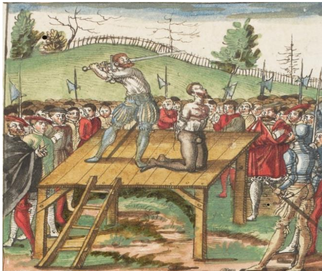
Рис. 2. Изображение казни Ганса Вальдмана из рукописи «Гельветской хроники» Кристофа Зильберайзена (Hinrichtung von Hans Waldmann aus der «Chronicon Helvetiae» von Christoph Silbereisen) Fig. 2. Image of the execution of Hans Waldman from the manuscript of Helvet's Chronicle by Christoph Zilberaisen

sen Chronicon Helvetiae, Teil III, S. 11r]. Так как автор был аббатом монастыря Веттинген в кантоне Ааргау, то рукопись предоставляет хорошую возможность увидеть казнь Вальдмана глазами церковнослужителя. Подробности жизни Зильберайзена и обстоятельства написания хроники неизвестны, еще меньше сведений сохранилось об иллюстраторе. Уверенно можно говорить только о том, что рисунки выполнял не сам Зильберайзен, а другой человек с инициалами «I.K.» [Zemp, 1897, S. 158–164], который, скорее всего, относился к духовному сословию.