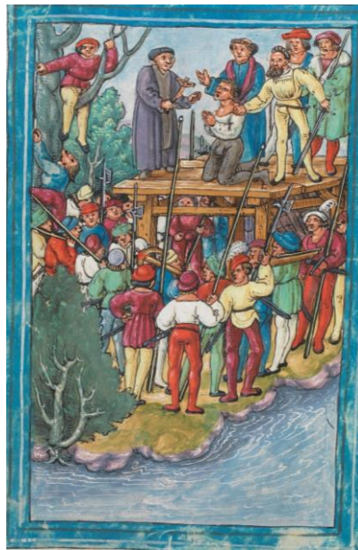
Рис. 1. Изображение казни Ганса Вальдмана из «Люцернской хроники» Дибольда Шиллинга Младшего (Hinrichtung von Hans Waldmann aus der Eidgenössische Chronik des Diebold Schilling (Luzerner Schilling)) Fig. 1. Image of the execution of Hans Waldman from the Lucerne Chronicle by Dibold Schilling the Younger

Несмотря на то, что по документам, сохранившимся в архивах Цюриха и других городов, известно, что знатные зрители располагались непосредственно около эшафота [Berner Bericht, S. 356], на рисунке толпа выглядит однородно, без каких-то явных деталей во внешнем виде, позволяющих отнести наблюдающих за казнью к разным сословиям. У некоторых из зрителей изображено перо на головном уборе, что, однако, не является однозначным признаком принадлежности к аристократии [Давыдов и др., 2012, с. 104–105].